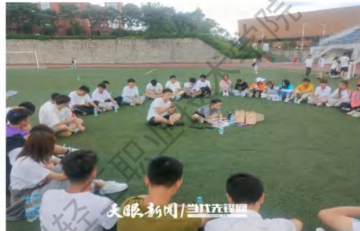
中软国际大数据产业学院学生在参加课外活动

2021年6月，中软国际参与贵州轻工职院主办的2021年工学交替双选会暨毕业生招聘会，为应届毕业生提供全方位的实习就业服务。本次招聘，中软国际联合自身业务线和合作企业共计为学生提供220个就业岗位。