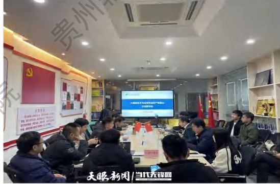
信息工程系举行大数据技术与应用专业产教融合交流座谈会

目前，学院共培养大数据技术专业毕业生1100余人，学生就业率保持在98%以上；大数据实训基地自提供社会服务以来，已培训相关人员5000余人次。