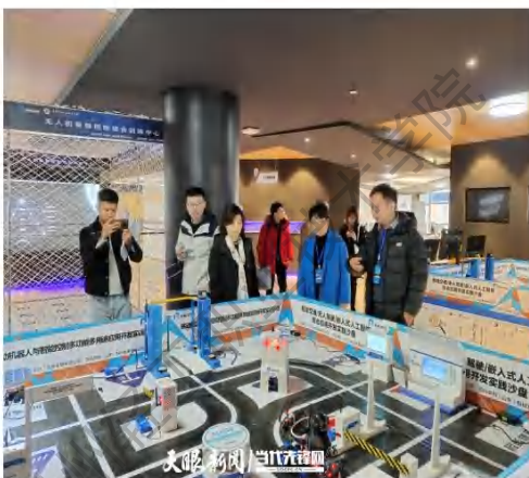
贵州省大数据发展管理局专家到贵州轻工职院大数据实训实习基地考察指导

培养高素质大数据技术技能型人才，需要多方资源的共同投入，打造多方互通互享的协同育人路径。针对企业育人资源稀缺的现状，贵州轻工职院携手贵安新区科创产业发展有限公司，联姻北京四合天地科技有限公司、贝格大数据等大数据行业企业，解决教育链、产业链、创新链有机衔接的问题。