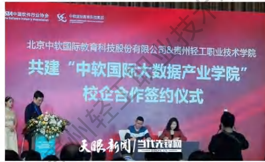
中软国际大数据产业学院签约仪式

2021年6月，中软国际参与贵州轻工职院主办的2021年工学交替双选会暨毕业生招聘会，为应届毕业生提供全方位的实习就业服务。本次招聘，中软国际联合自身业务线和合作企业共计为学生提供220个就业岗位。