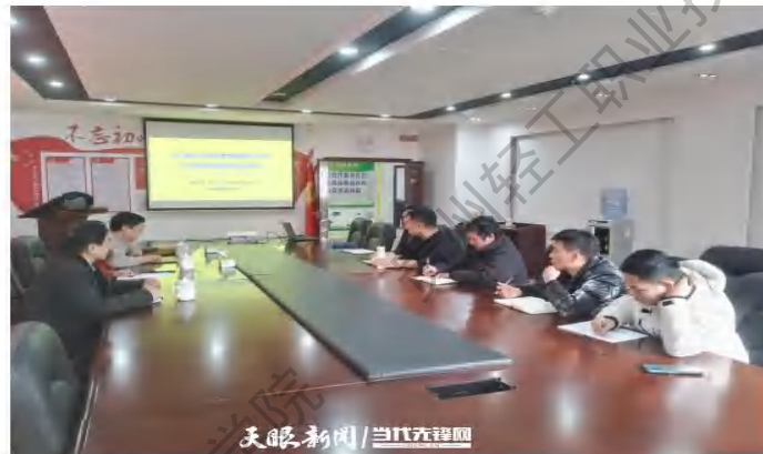
信息工程系开展企业信息化调研与帮扶活动

贵州轻工职院以大数据技术与应用专业为试验田，带动全校相关专业融合开展“岗课赛证”创新教育，开创了“线上+线下、课内+课外”的多元混合式教学法。其中，通过“大数据+”的应用，带动酿酒技术、艺术设计、物流管理等专业成为省级和国家级重点专业，以“数”为技术支撑的专业特色更加鲜明，获省级以上荣誉和奖项110余项，产出国家级标志性成果38项。