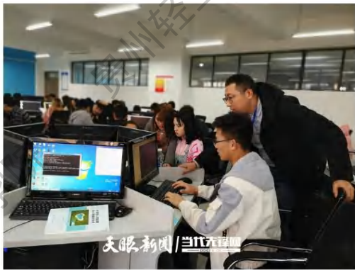
中软国际大数据产业学院教师在给学生授课

2020年，贵州轻工职院与北京中软国际教育科技股份有限公司联合组建中软国际大数据产业学院，以满足新一代信息技术产业人才需求为导向，以培养具备一定创新能力的技术型、技能型人才为核心任务，校企双方共同探索产教融合协同育人新模式。