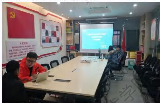
中软国际大数据产业学院学生人才测评建档

在人才培养实施过程中，为以后能更好地为学生提供教学和定制化就业服务，产业学院从学生大一入学开始逐一面对对学生进行人才测评，为学生建立人才画像档案，每学期实时更新。